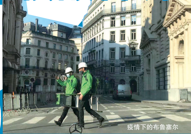
疫情下的布鲁塞尔