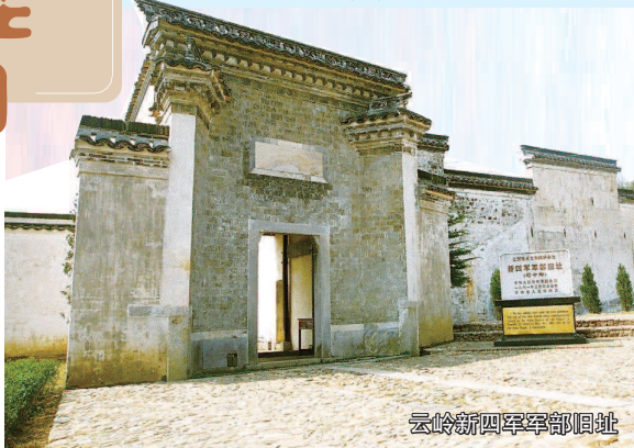
云岭新四军军部旧址

安徽，作为新四军军部所在地、“东进之路”起始地、“皖南事变”发生地，同时也作为文房四宝中的徽墨宣纸砚歙产地，以及以宏村为代表的世界文化遗产——皖南古村落发源地，将红色文化和徽州文化相结合，催生了“体验感+参与性”的皖南红色之旅。