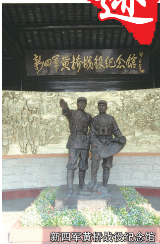
新四军黄桥战役纪念馆