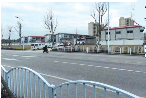
■ 工地上只见几排活动板房

2019年完成建设公示的幼儿园,为什么到现在还没动静呢?记者联系了建设单位上海蟠龙天地有限公司,工程部工作人员介绍,该建设项目“施工许可证还没拿到,图纸还未完”。