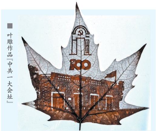
■ 叶雕作品「中共一大会址」