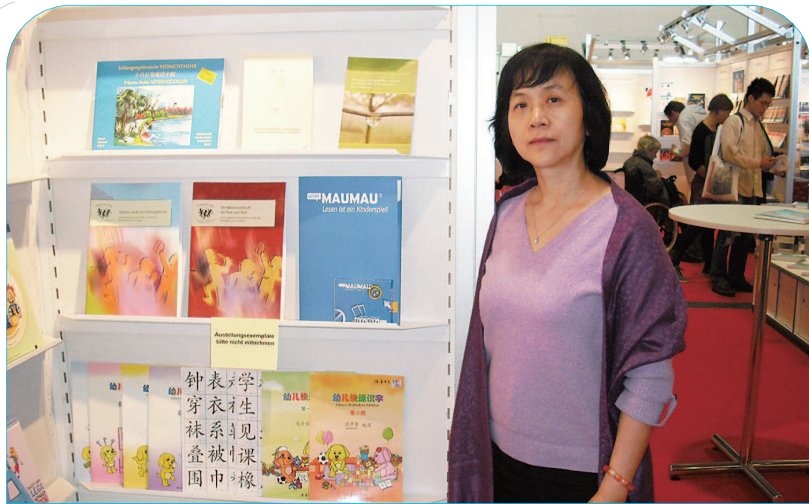
▲ 2011 年,周开霁编撰的《幼儿快速识字》参展德国法兰克福国际书展