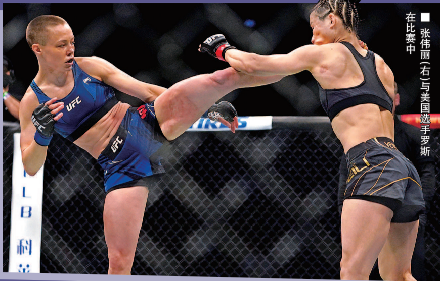
■ 张伟丽(右)与美国选手罗斯在比赛中