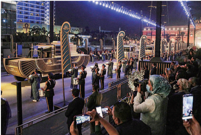
■ 木乃伊车队吸引众多开罗市民围观