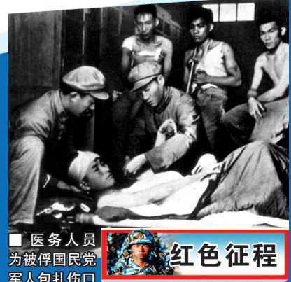
■ 医务人员为被俘国民党军人包扎伤口