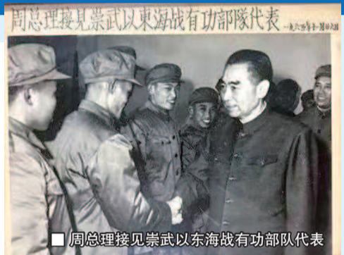
■ 周总理接见崇武以东海战有功部队代表

讲述那个“生死之夜”,年过八旬的赵正东依然激情澎湃,“我们是小艇战大舰”,他描述道,“永泰舰和永昌舰的排水量都超过600吨,均装有76.40毫米中口径炮,打得远,威力大,而我们能出动的只有百吨上下的护卫艇、鱼雷艇,护卫艇只有37、25毫米小口径炮,而我们鱼雷艇如果打光了自带的几条鱼雷,就只有两座25毫米炮甚至12.7毫米机枪自卫了,火力上有差距。”