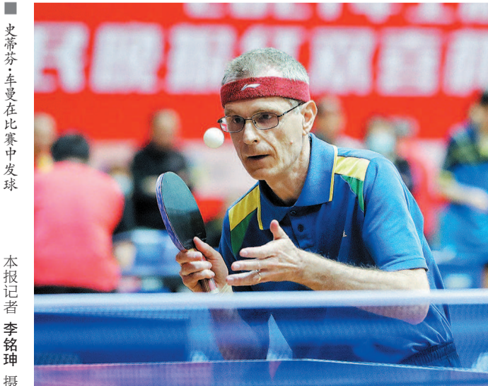
■ 史蒂芬·车曼在比赛中发球