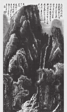
2020秋拍 李可染《高岩飞瀑图》成交价1.16725亿元