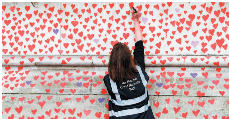
表一名因新冠去世的英国人

印度上周新增新冠确诊病例逾48万例,比前一周多三分之一,其中印度最大城市孟买所在的马哈拉施特拉邦疫情形势尤为严峻。为遏止疫情传播,该邦决定从5日起实行宵禁等措施,在此期间仅允许提供必要服务的商店等场所营业。商场、餐馆、影院、泳池等将关闭。邦内公共交通工具上,最多允许最大客容量的一半人同时搭乘。