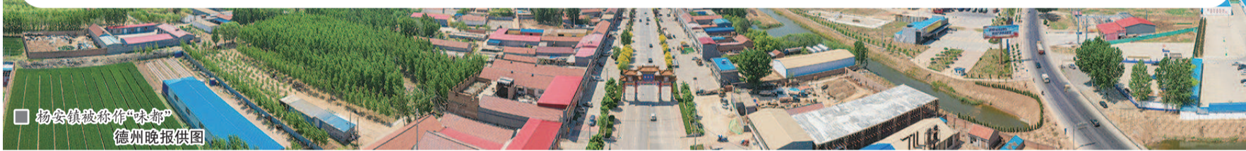
杨安镇被称作“味都”

在德州，乡村振兴的融合发展，大量资金、技术、人才转向农村，让农村享受到更多发展的红利。各区域不尽相同的发展之路，更显各美其美、百花齐放。本报记者 杨洁