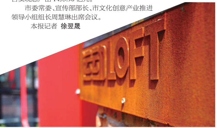
■ 德必文化创意园区成为一道风景