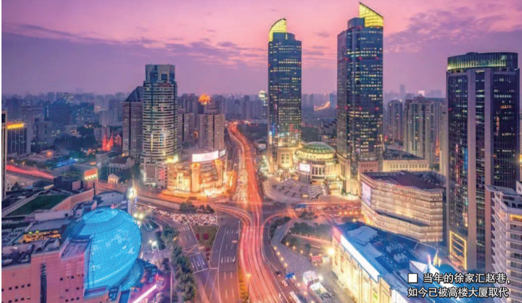
■ 当年的徐家汇赵巷，如今已被高楼大厦取代

徐家汇商圈和居民区交界的地方，曾有一条叫做“赵巷”的弄堂。从上世纪 20 年代起，一批革命者聚集在这里，留下了许多红色的足迹。近日，新民晚报与新华传媒联合发起的“寻找 100 份红色记忆”主题征集活动收到一份投稿，揭开了这段尘封多年的历史。