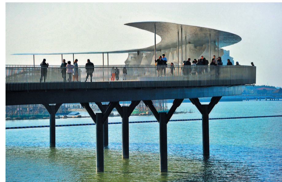
位于青浦淀山湖以西的元荡湖连接沪苏两地,其生态湿地与环湖绿道对接,水系串联起千帆归渡、圆梦云台、汾湖之眼等丰富的旅游资源