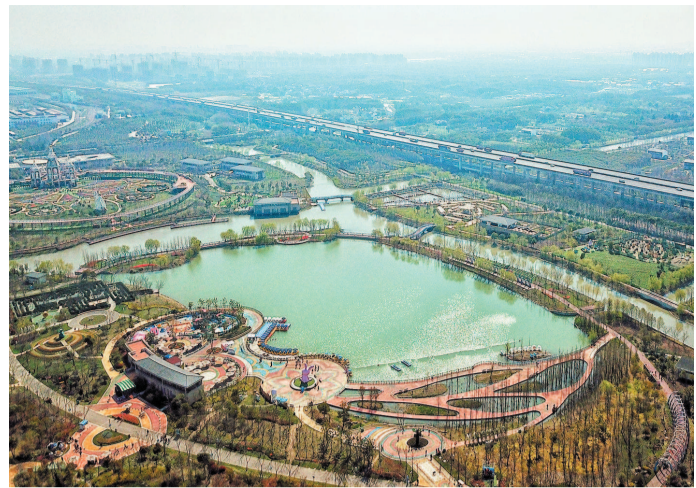
浦江郊野公园里河、湖俱有,水系发达,打造出一片自然滨水生态休闲地