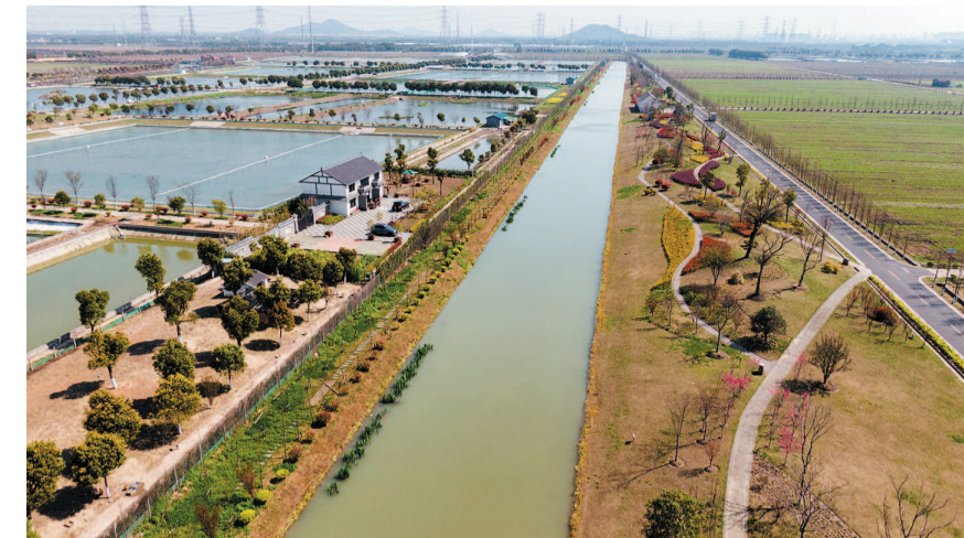
松江区荡湾村通过新建生态斜坡式护岸、水系沟通、种植绿化和水生植物等措施,极大地改善了水质,呈现出“水清、面洁、河畅、岸绿、景美”的景象