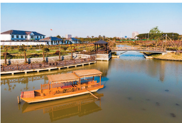
浦东长达村打通村内多个水体,架设桥梁,净化水质,美化景观

水库村则已建成生态栖息、林水复合、农水复合3处湿地及70多个孤岛或半岛,呈现“河中有岛,岛中有湖”的景象。常年保持Ⅳ类水以上标准的河道,水清、岸绿、景美,可远观、可触碰、可聆听、可遐想,让人看得见良田,望得见清水,记得住乡愁。