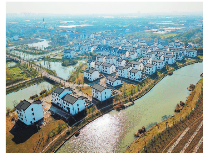
闵行区浦江镇莘新村内河网水系发达,现有河道55条段