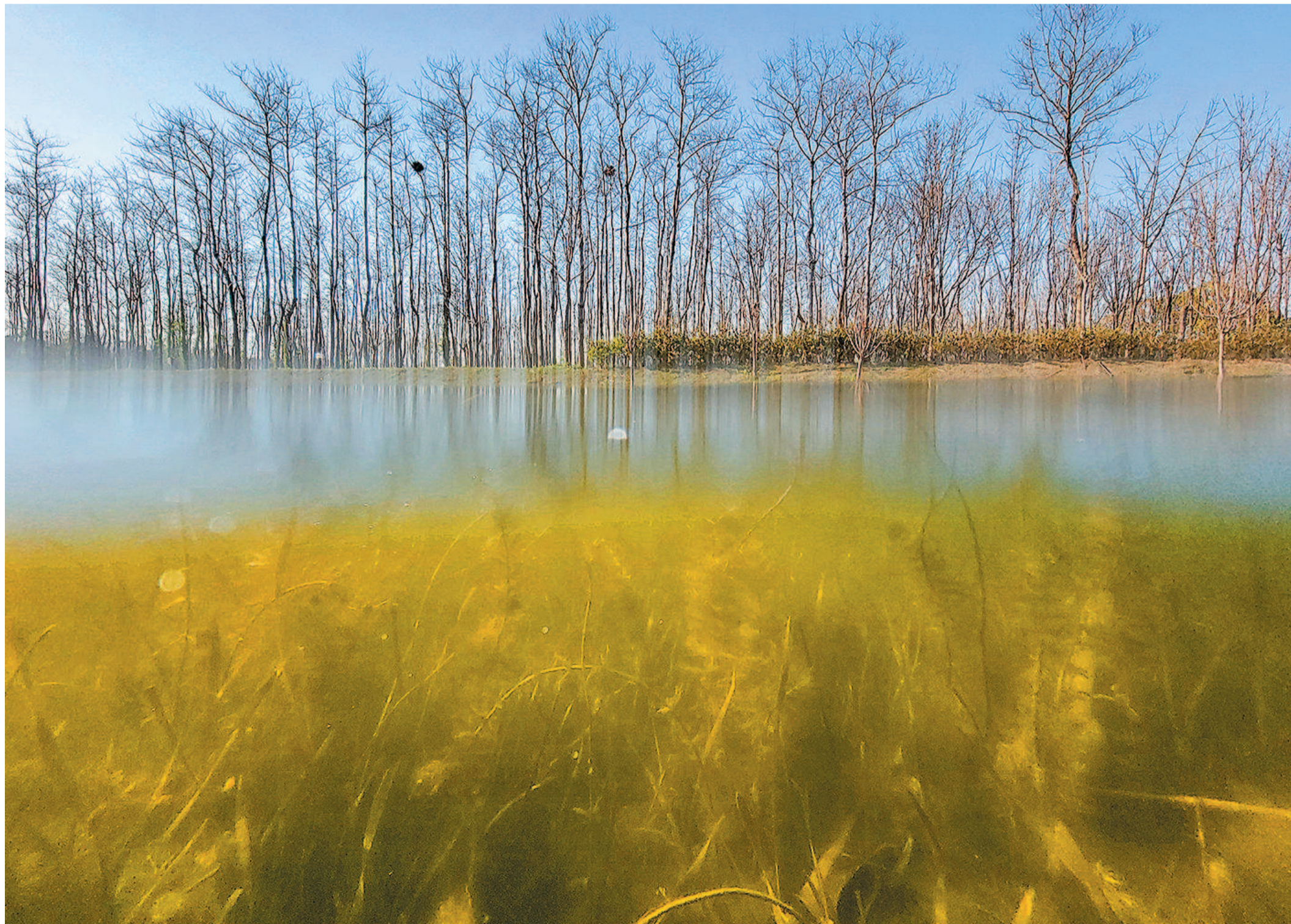
三仙沟位于宝山区罗泾镇塘湾村境内,全长960米。2018年,罗泾镇对其进行生态治理,构建“水下森林”净化系统,逐步实现“水清、水净、水活、水美、水灵”的治理目标