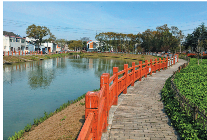
闵行区浦锦街道丰收村水系纵横,景观河道让这里既像开放式的公园,又不失江南乡村气息