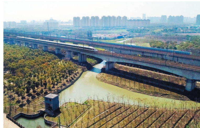
高铁从嘉定区南周泾河道上飞驰而过。经过美丽乡村河道综合整治工程,河道成了村民家门口的一道风景