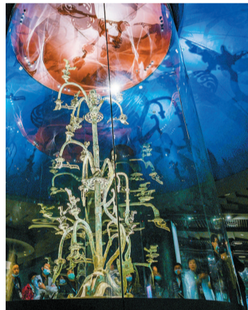
位于三星堆遗址东北角、地处广汉城西鸭子河畔的三星堆博物馆,是我国迄今为止发掘的全部青铜文物中形体最大的一件。

1986年,三星堆1、2号祭祀坑抢救性发掘完成。3年后,三星堆博物馆主体建筑设计方案通过审定。再3年后,三星堆博物馆奠基。又过去5年,三星堆博物馆建成开放,纵目阔嘴的青铜面具、高鼻大耳的青铜立人、流光溢彩的黄金面罩,叫每一个参观者赞叹、难忘。