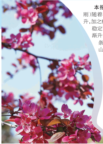
娇艳的北美海棠

据悉,海棠文化节活动为期一周,其间还将设海棠花主题旗袍秀、剪纸、舞扇操、大合唱等活动,同时举办历届海棠花摄影绘画作品展览,希望能够通过作品记录园内绚丽的春花景致,更好地挖掘海棠的文化底蕴。