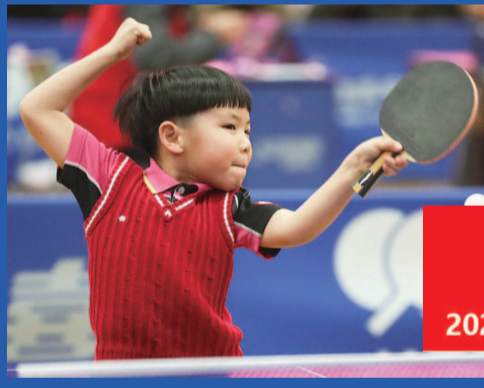
2020 东京 (乒乓羽球)

赛事热线>>> 三杰体育 021-52373901 (工作日 10:00-17:00) 更多赛事信息请关注微信公众号 UTTL 城市乒羽联盟 (uttlpingpang)、三杰体育 (sanjietiyu), 赛事官网 www.sunagesh.com