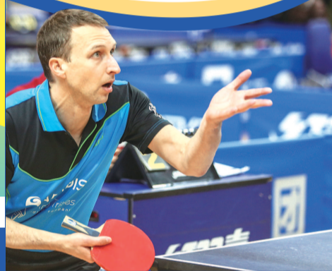
往届“红双喜杯”资料图

赛事热线>>> 三杰体育 021-52373901 (工作日 10:00-17:00) 更多赛事信息请关注微信公众号 UTTL 城市乒羽联盟 (uttlpingpang)、三杰体育 (sanjietiyu), 赛事官网 www.sunagesh.com