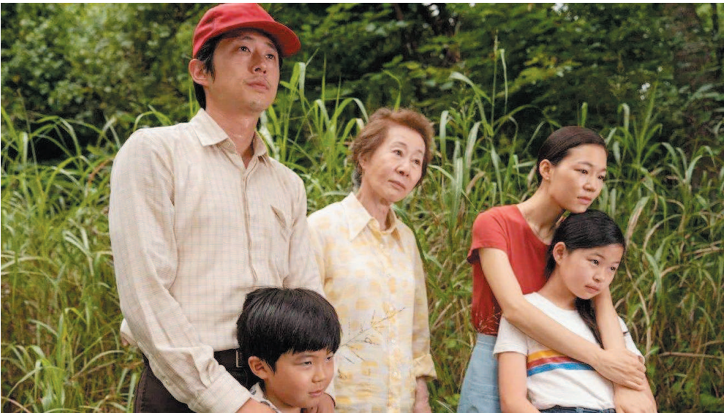
韩国影片《米纳里》是今年奥斯卡热门

以获奖人数比例为例,1980年至2015年获奥斯卡奖的男演员中白人84%,非裔10%,西裔和亚裔各3%,女演员中白人89%,非裔