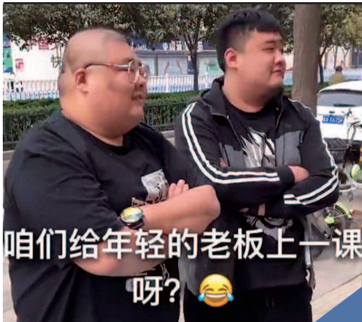
咱们给年轻的老板上一课呀？😂