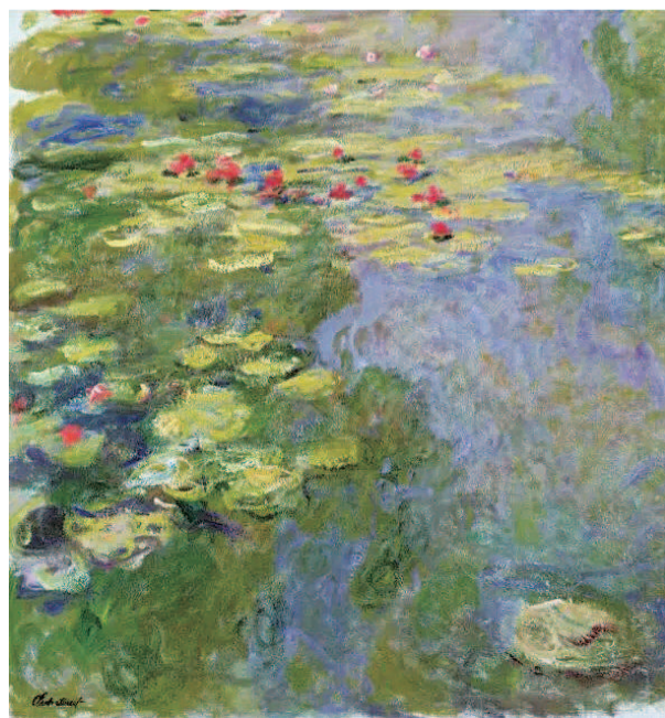
■ 《睡莲池》,克劳德·莫奈 1917-1919

这是一场迟来的展览,原计划在去年3月开展的“莫奈与印象派大师”特展因为新冠肺炎疫情被迫两次延期,推迟了整整一年。这也是法国玛摩