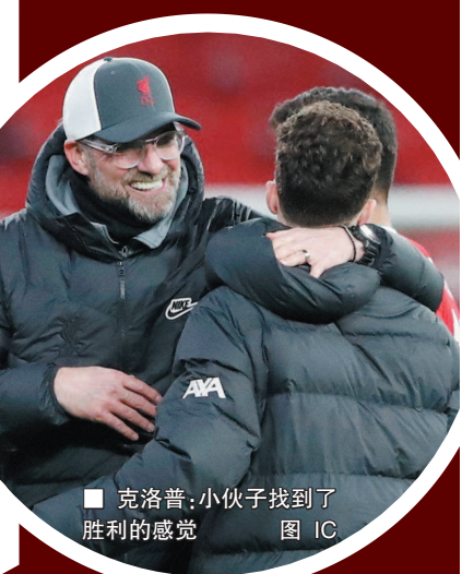
■ 克洛普: 小伙子找到了胜利的感觉

红军教头笑着说。利物浦高层已经许诺全力支持克洛普的工作, 并提供更多的引援资金, 而伴随着红军状态的复苏, 或许用不了多久, 球迷们就能再次看到那个喜欢在赢球后放声大笑, 再来一套组合拳表演的霸气“渣叔”了。本报记者 陆玮鑫