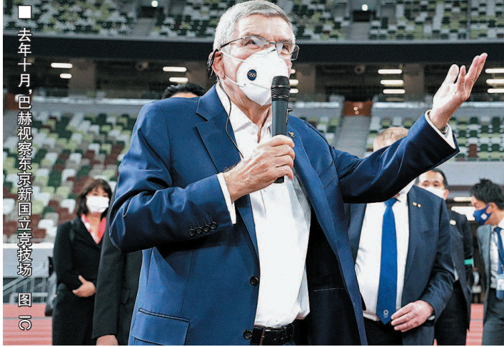
去年十月, 巴赫视察东京国立竞技场