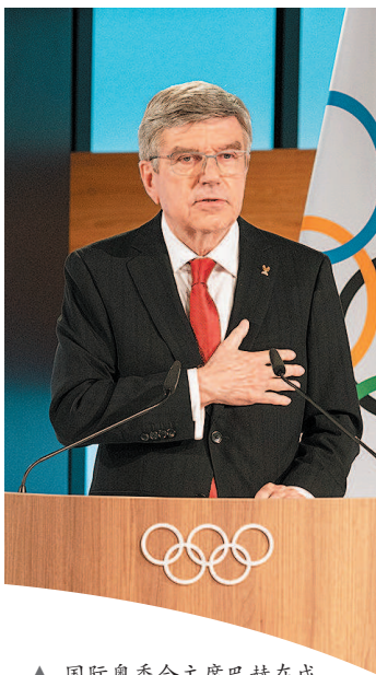
▲ 国际奥委会主席巴赫在成功连任后发表讲话

巴赫曾是一名击剑运动员, 代表德国夺得1976年奥运会冠军。他1991年成为国际奥委会委员, 五年后出任国际奥委会执委, 长期主管项目委员会、司法委员会等重要部门。2000年当选国际奥委会副主席。2013年, 巴赫接替比利时人罗格, 当选第九任国际奥委会主席。本报记者 黄永顺