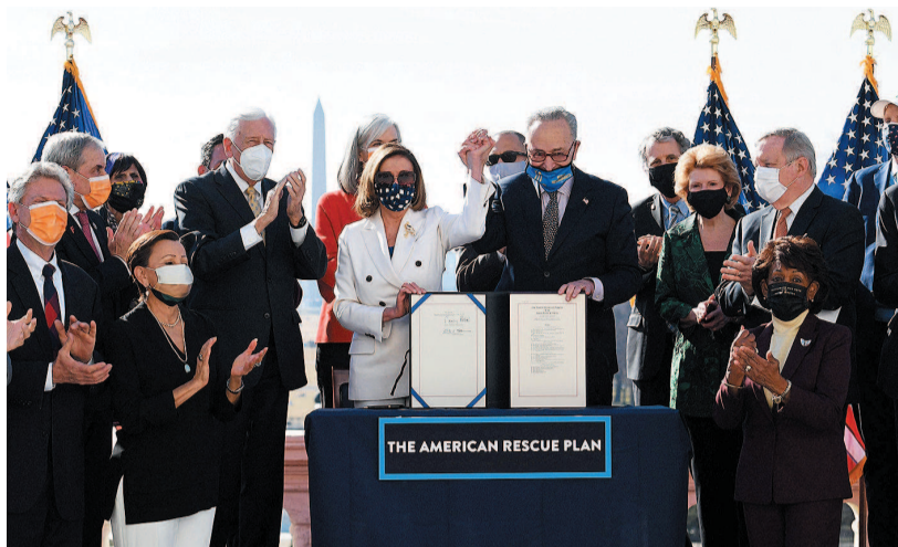
众议院议长佩洛西(中左)和参议院多数党领袖舒默共同展示经济救助计划文本 图②

由于为应对新冠疫情推出的紧急失业救济计划即将在14日到期,美国国会民主党人希望尽快出台新一轮救助计划。由拜登提出的1.9万亿美元经济救助计划最初版本2月27日在众议院获得通过,参议院本月6日通过经修改的计划,删除了将法定联邦最低工资从每小时7.25美元提高至15美元的内容,并修改了有关失业救济福利的内容,该计划被送回众议院重新审议和投票。(乔伊)