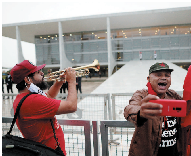
▲ 卢拉支持者在总统府前欢庆胜利 ▲ 圣保罗一座建筑上打出“对卢拉的公正审判”字样

巴西联邦最高法院大法官法欣8日宣布恢复前总统卢拉的政治权利,巴西各界对此反应强烈。分析人士普遍认为,这一决定可能提前拉开2022年巴西总统选举序幕。