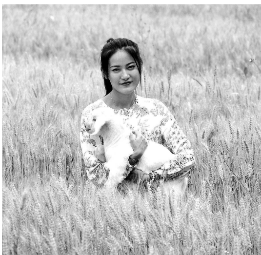
▲ 上海市金山区张堰镇日脚农场