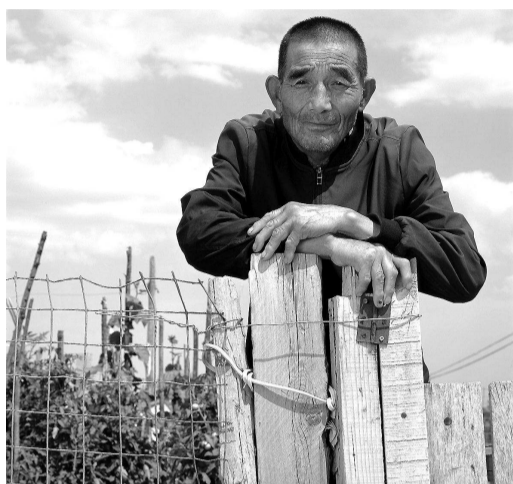
▲ 王存升 摄于宁夏回族自治区银川市吴忠市盐池县王乐井乡李渠子村