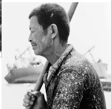
▲ 山东省威海市石岛镇大鱼岛