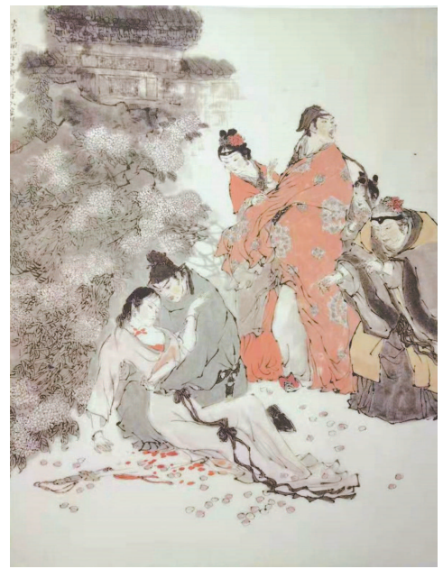
红楼梦第六十六回 戴敦邦 绘

突如其来的新冠疫情让幼儿园假期特别长。蕙蕙耐心地待在家里。小家伙没有闲着,每天折几个纸飞机放在抽屉内。产品一多怕搞错,拿起五彩蜡笔,分别画上熊猫宝宝、小黄鸭、大萝卜等。幼儿园一开学,今天带一个“熊猫号”上学;明日则换为“黄鸭号”。达到自由活动时间,她与小朋友在绿草坪上分散站好。蕙蕙作为“机长”一声号令,银燕即刻启航。她用力将小飞机交给小胖。小胖接机后,立即抛向“小甜饼”。最好笑的是“胡萝卜”,她竟将飞机直接甩到“机长”的飞行帽上。和煦的阳光下,蕙蕙的帽檐上一行红字熠熠生辉:长大我要造大飞机。