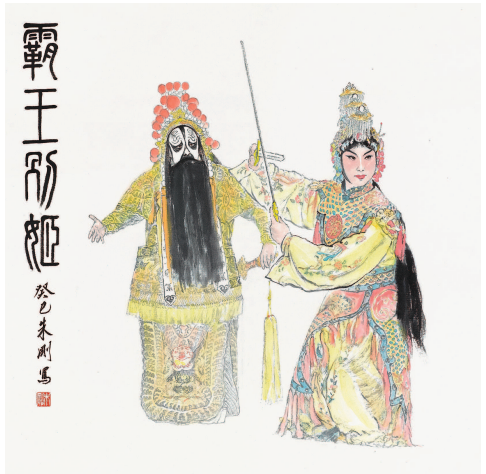
霸王别姬 (设色纸本) 朱刚

看过大教堂，又去一处位于近郊、不同建筑风格的教堂。正值弥撒，我没进去，在门口等朋友。走出大门的老太太们立即扎堆聊了起来，明明是老熟人，却仿佛他乡逢故知。晚上在城郊的餐馆吃饭，旁边几桌也是边吃边聊，热火朝天。餐馆领班