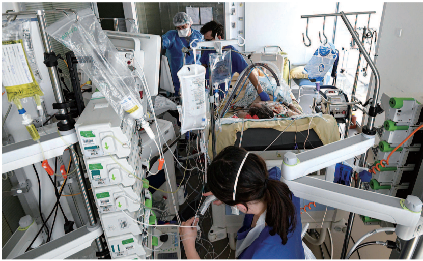
■ 法国医护人员在重症监护室照顾患者

但一个危险的信号表明不应放松警惕。得克萨斯州重镇休斯敦首席医疗官珀斯9日宣布,在该市一半以上污水处理厂中都检测到在英国发现的变异新冠病毒。美国疾控中心曾表示,新冠病毒可以由有症状或无症状的感染者排出,而废水检测可以提供社区内病毒感染变化的数据。