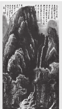
2020秋拍 李可染《高岩飞瀑图》 成交价1.16725亿元