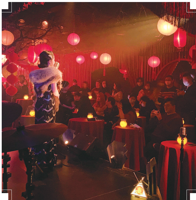
■ 沉浸式戏剧《不眠之夜》演出现场

剧场之外,8家院团还精心挑选了近30台精彩节目每天和观众云上相见,让艺术的力量陪伴观众新的一年“艺起前行”。上海杂技团的《“艺起前行”新春版之“牛”转乾坤系列》从大年初一持续到初三,用杂技语汇展现了2021“扭转乾坤”的信心。另外,上海话剧艺术中心的《热干面之味》《那年那时那座城》、上海歌舞团的舞剧《天边的红云》、上海木偶剧团的《过大年,品年味一萌偶给您拜大年》、上海轻音乐团的《巨龙昂首》、上海音乐剧艺术中心的《面试》剧组线上展演等,也都为观众奉上了令人眼花缭乱的视觉大餐。据统计,新春期间8家院团云上展演的播放超过15万次。