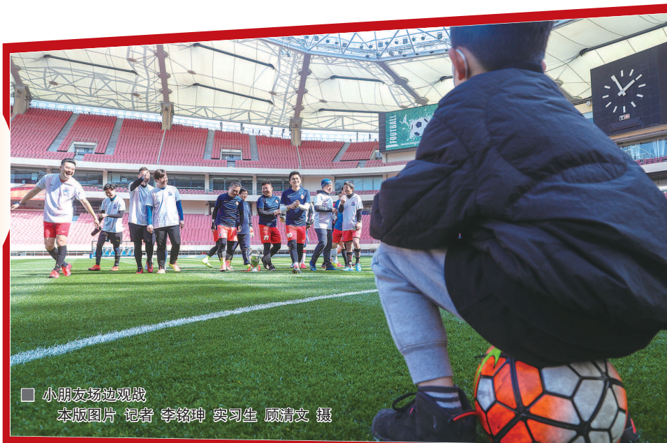
小朋友场边观战

昨天是大年初五，虹口足球场内场首次在春节期间向市民开放。对沪上球友来说，就地过年有了全新的方式——新年的第一场球，去心中的圣地牛气冲天，“牛”转乾坤。