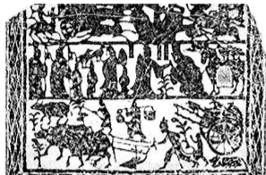
1952年睢宁出土牛耕画像石

演春的内容是抬着春牛及芒神举行迎春的民俗游艺活动，其中主要是民间艺术的表演。如《铁岭县志》卷二十记载：“立春为国