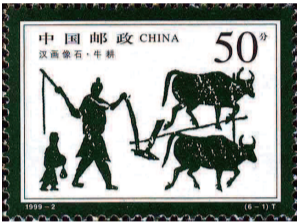
1999年发行的邮票《汉画像石》之一取材于1962年出土于绥德县的“牛耕图”

家盛典。前一日，守土官率僚属，盛陈卤簿仪仗，杂以秧歌、龙灯、高脚、旱船等剧，并具芒神、春牛往东关高台拈香行礼，俗曰演春。”