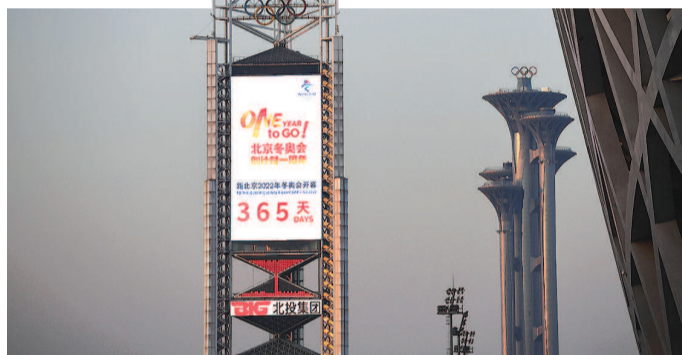
北京冬奥会倒计时一周年

从北京2008年奥运会到北京2022年冬奥会,时光跨越了14年,也似乎只隔了一个秋冬。祥云幻化为雪花,寓意着北京这座双奥之城的传承与创新。中空开放的设计,也隐藏着古老东方文明的哲理与包容。