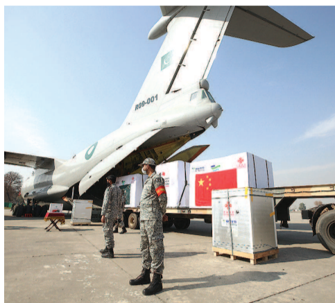
中国疫苗抵达巴基斯坦努尔汗空军基地

可让福斯等西方学者惊叹的是,作为上市疫苗最多的国家之一,中国正以向巴基斯坦等更困难的发展中国家援助或以公平合理价格出售的方式提供疫苗,拒绝“权力的诱惑”。