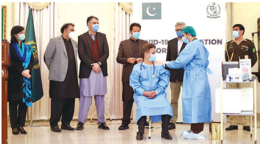
巴基斯坦举行新冠疫苗接种启动仪式