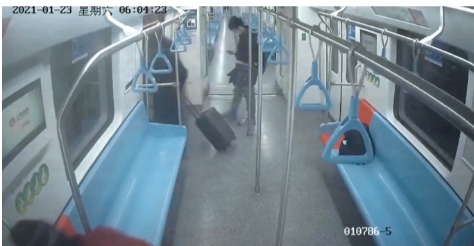
包在车厢内被找到