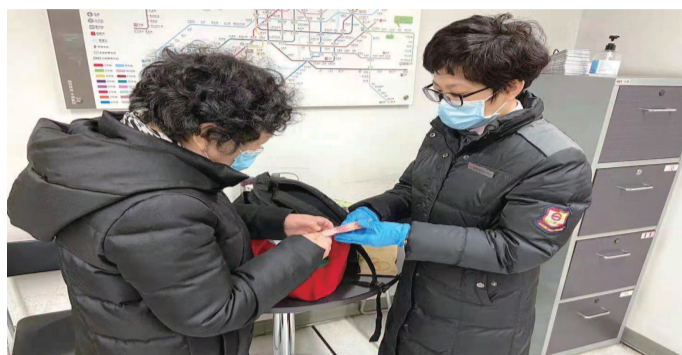
失主激动地领回失物