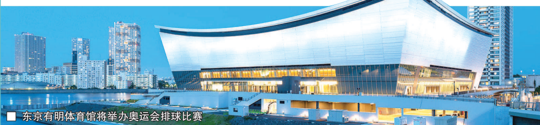
■ 东京有明体育馆将举办奥运会排球比赛

受疫情影响,今年的亚冠小组赛将采用赛会制进行,1/8 决赛和 1/4 决赛均为单场淘汰制。进入八强后,将不再有东西亚区球队之分,而以混合抽签的方式决定对阵形式。外援方面规则没有变化,仍将采取 3+1 政策。