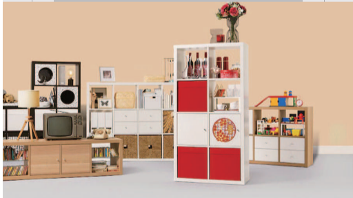
适合春节场景的卡莱克搁架单元