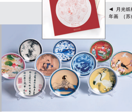
月光纸桃花坞木刻年画 (苏州博物馆)