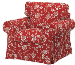
红色版爱克托沙发