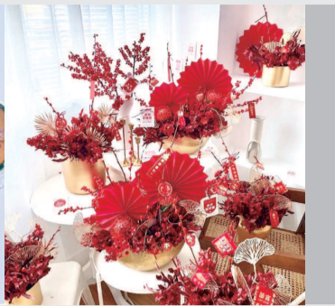
可增添春节室内气氛的花卉摆件