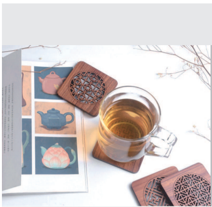
吉祥杯垫 (上海博物馆)