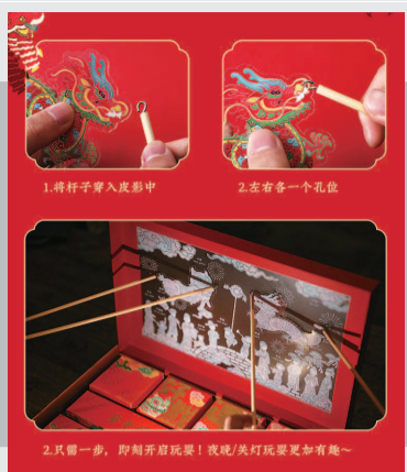
“好戏连台”包装加入了皮影戏元素