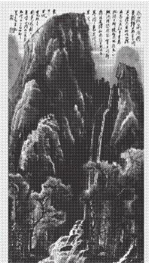
2020秋拍 李可染《高岩飞瀑图》 成交价1.16725亿元