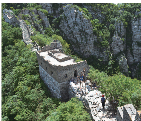
北京市怀柔区箭扣长城修缮工程三期施工现场

此外,今年怀柔区还将完成四处长城点段的抢险工程,从多方面做好长城管护工作。同时,还将通过数字化工程、创编怀柔明长城纪录片等方式,进一步做好长城文化带建设工作。