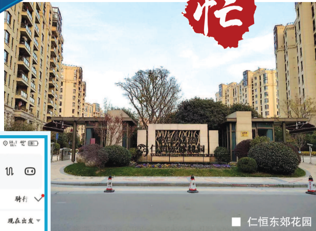
▲ 导航软件显示坐公交前往最近菜场要花费半小时