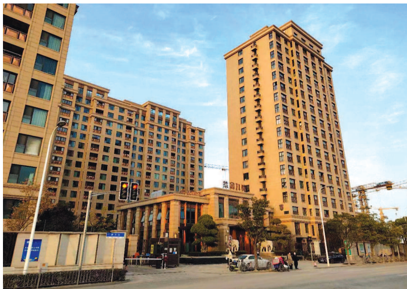
▲ 德淳路99弄大名城紫金九号小区