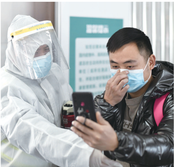
今天上午10时,在铁路上海站西南出口,上海站地区管委办的工作人员正在查验途经中、高风险地区旅客的健康码,并告知上海的疫情防控措施