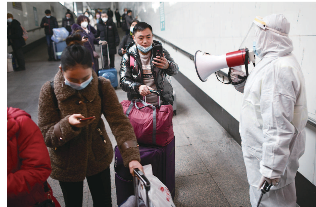
上海站地区管委办的工作人员在出站通道内查验所有旅客的健康码

进站必须戴口罩,没有口罩怎么办?进站、出站,如何给旅客测温?哪些地方来的列车,旅客下车后、出站时需要查验健康码?……带着这些疑问,今天上午,记者来到铁路上海站,实地探访相关部门是如何做好疫情常态化防控措施的。车站是做好疫情防控工作的“前沿阵地”。上海市昨天公布冬春季来沪返沪人员8条防控措施,其中一条就是:机场、车站、码头等交通客运场(站)加强对来沪返沪人员的体温测量和健康码查验。上午9时许,记者来到铁路上海站南广场,进站时发现,所有旅客都规规矩矩地戴着口罩,旅客毛先生说:“做好防护是为了自己,也是为了别人,车上时间较长,我特意去买了N95口罩,防护得更好一点。”记者在西南出口看到,铁路工作人员坐在电脑前,他们负责监控红外测温仪实时数据,所有到达旅客都必须测温后才能出站,旅客们自觉拉开距离,一一过检。一位工作人员说:“我们得神经紧张地盯着电脑屏幕,任何‘超标’的温度都不能放过,比如有旅客带着装有热水的保温杯,可能引起系统报警,这时就要甄别、重新测温。”上午10时,从太原开来的Z198次列车抵达铁路上海站,上海站地区管委办的工作人员穿着“大白”防护服,就在出站通道内查验所有旅客的健康码。目前铁路上海站已从河北石家庄始发的列车,但每天有4趟列车(从呼和浩特、太原等地始发)途经石家庄、抵达铁路上海站,从这些列车下车的旅客,如果健康码显示红色,就会被立即隔离;如果有发烧症状的,现场等候的救护车会送这类旅客前往定点医院进一步检查和诊疗。“哪些车属于重点列车,这是动态调整的。目前来看,重点列车出行旅客人数不是很多,比如今天的Z198次,到铁路上海站的旅客在百人左右。”工作人员说。本报记者 金志刚