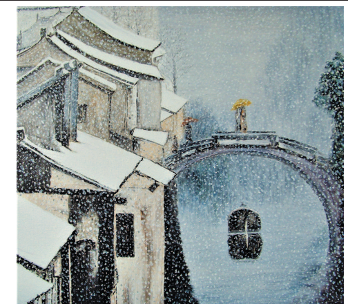
水乡瑞雪 (油画) 徐宜超

转眼又是新岁，时光于季节的轮回里老去，渐成心底最柔软的清欢所在，不经意在回忆里时隐时现。