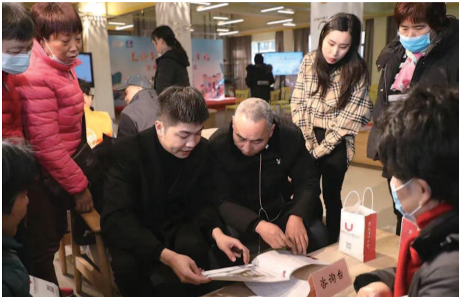
■ 家庭装饰设计、施工咨询现场

近期,真如镇街道成立了“真如意·党建联盟”,以“医、食、住、行”为纽带,构筑了资源共享、优势互补、共驻共建的区域化党建新格局。去年,街道全面推进“三旧”换“三新”工作,八二居民区的一些居民迎来了“老房有喜”,目前正进入外搬过渡阶段,不少居民在“断舍离”的过程中,也纠结着未来的新房要怎么装修。华鼎建筑党委关心