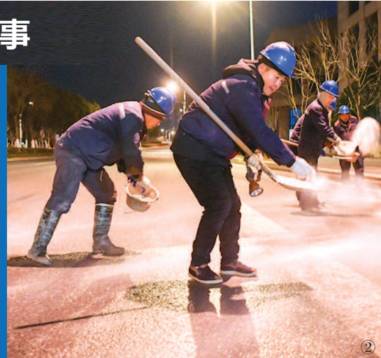
① 工作人员通过“临港之眼”观察到，一处道路积水原因是消防栓渗水 ② 处理完渗水情况，抢修人员设置维修警示牌并铺撒工业盐防止道路结冰