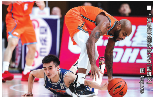
上海男篮发挥失常不敌「副班长」