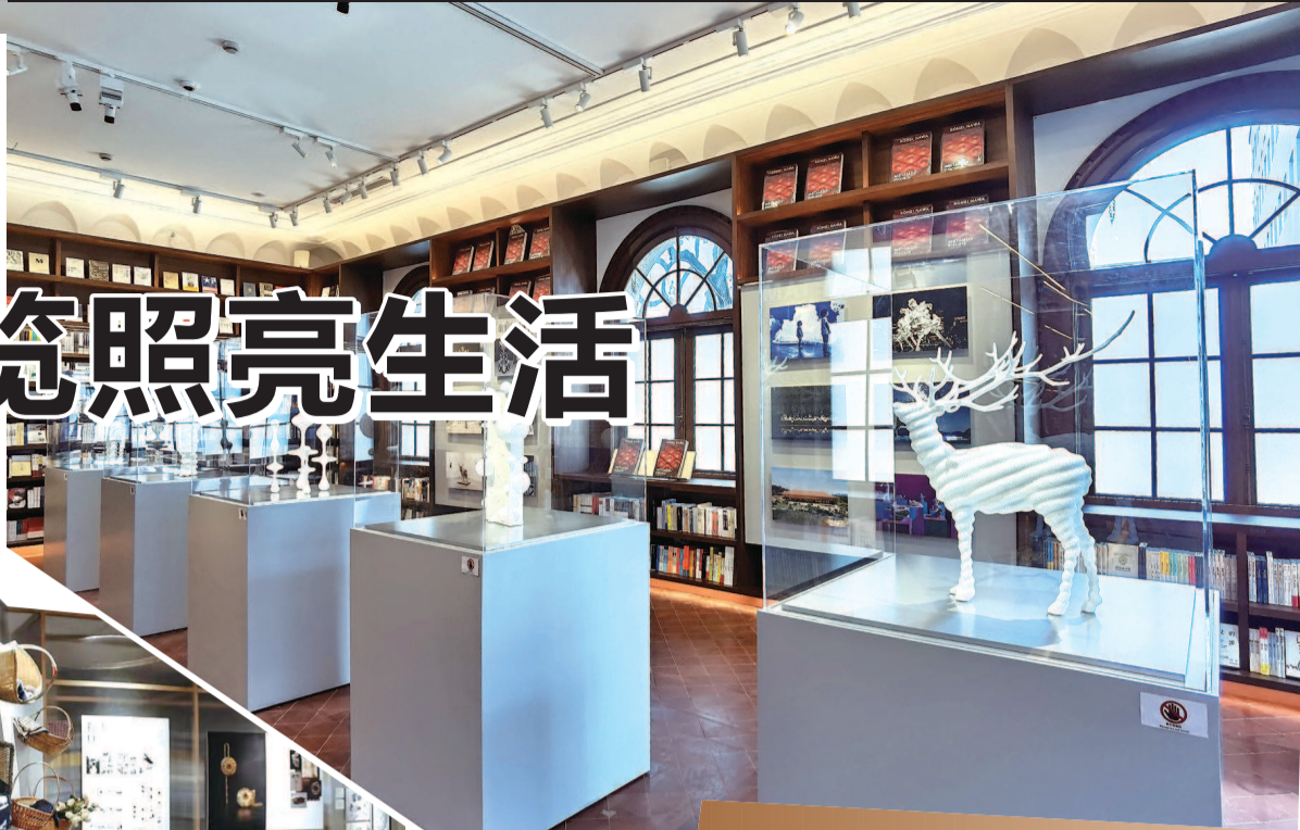
▲ 上生新所葛屋书店里展出的日本雕刻家名和晃平的雕塑系列《Particle》