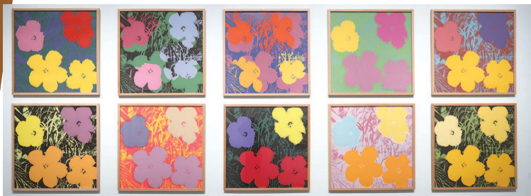
■ 安迪·沃霍尔的作品

在本次展出的两件影像作品中,《内外空间》记录了上世纪60年代的美国当红影星伊迪·塞奇威克坐在电视机前,与屏幕中的自己以及拍摄者对话的场景。另一件影像作品《胡安妮塔·卡斯特罗的一生》讲述了一起家庭闹剧。