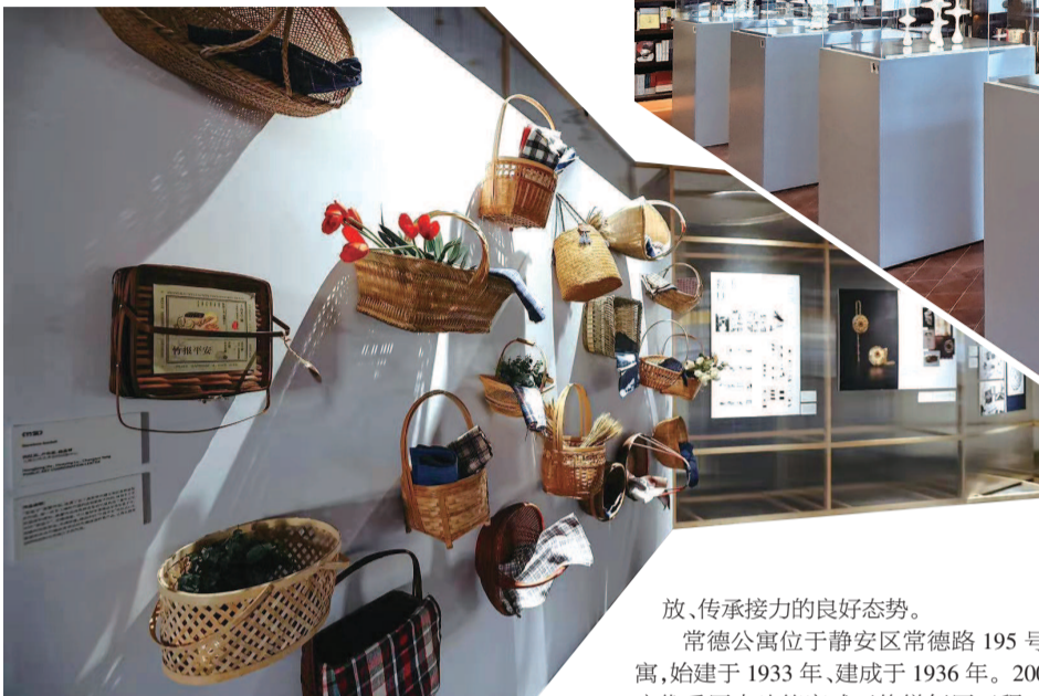
■ “有温度的设计”展现场

2021年的阳光已经洒满了城市的每一条道路,艺术的气息在新年里带来新的希望。在过去的一年里,我们从年初的宅家模式渐渐回到熟悉的展厅里,虽然增添了一个预约的步骤,但是也让我们在面对艺术品时更多了一份仪式感。