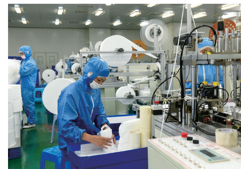
● 昨天,金山工业区的玉川卫生用品(上海)有限公司内,300多名员工在井然有序地进行口罩生产作业,确保新年口罩市场供应