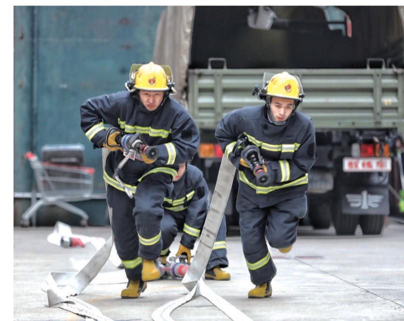
● 昨天一早,长宁消防救援支队天山消防救援站的消防员们就练上了。其实,对这群身着火焰蓝制服的小伙子们来说,每一天每一刻都是工作日工作时