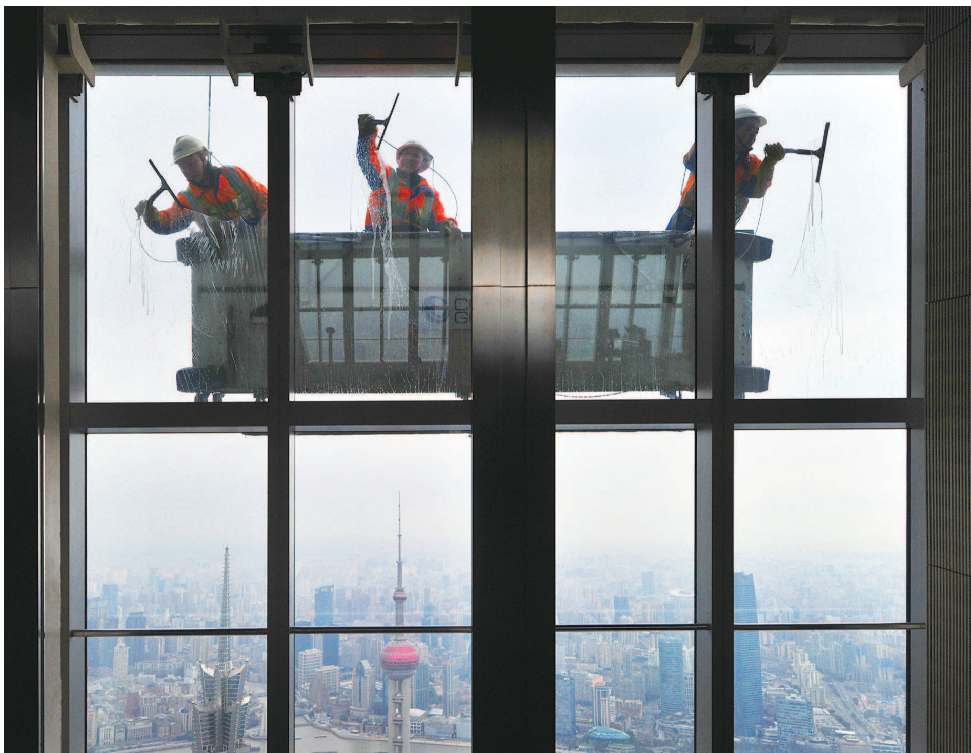
● 昨天,在陆家嘴上海环球金融中心近500米的高空上,专业高空作业人员赶在新一波寒潮到来之前,加紧清洗观光层的外墙玻璃,让广大游客能更清晰地观赏浦江两岸美景