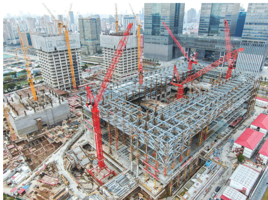
● 昨天,上海博物馆东馆新建工程正有序推进,该项目已于上周顺利实现主体钢结构封顶