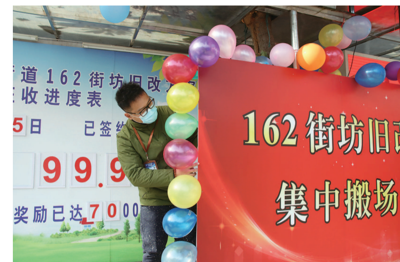
● 昨天是杨浦区江浦街道162街坊旧区改造居民集中搬场的日子。杨浦第三征收服务有限公司工作人员朱晓飞早早来到征收办布置会场。据了解,今年杨浦区力争完成二级以下旧里改造1.5万户