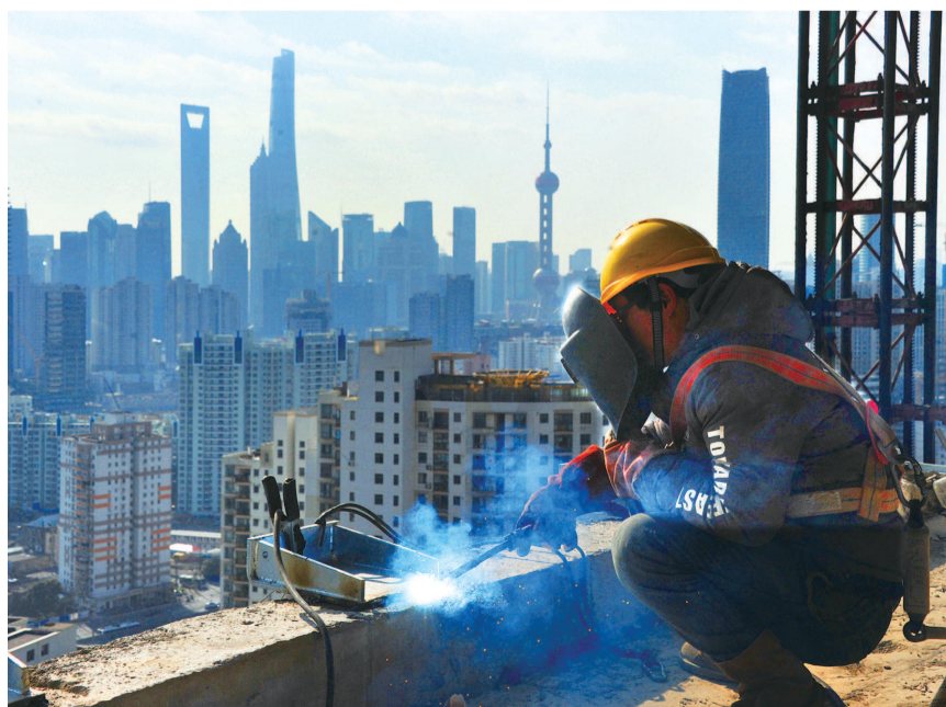
● 昨天,在虹镇老街旁的中建三局瑞虹10号项目“太阳宫”建筑工地,建设者正在高楼上加紧幕墙预埋件电焊作业