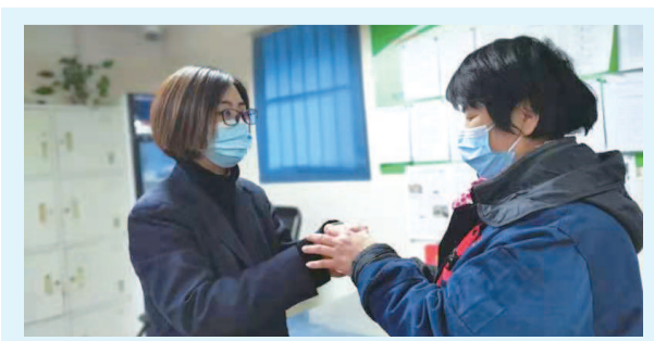
为环卫师傅送上热茶