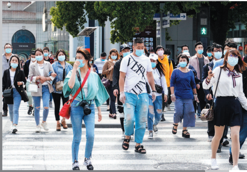
■ 上海举办“五五购物节”,市民逛街购物