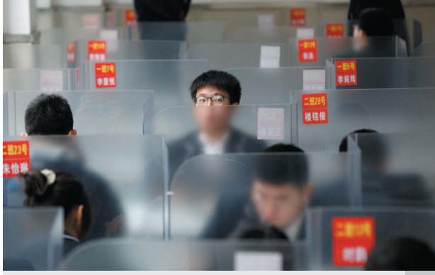
■ 华山医院抗击疫情表彰大会上,张文宏医生开心地伸出大拇指