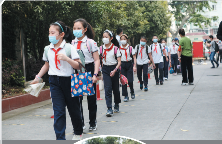
■ 长宁实验小学迎来まご名四、五年级学生,校园重现生机