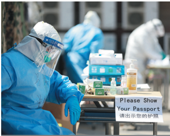
■ 闵行区“临时集中留验点”,疲惫的医护人员抓紧空闲时间休息,恢复体力

珍惜生命,敬畏自然,同舟共济,勇于担当,是我们抗击疫情的灵丹妙药,也是人生路上最为珍贵的财富。消灭疫情,驱逐寒冬,总有一天病魔会被人类打败,等到春暖花开的时候,自信、无畏、感恩将流淌入每个人的心间,我对此深信不疑,且充满期待。