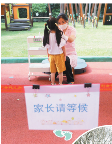
■ 中福会托儿所按照“一园一策”的要求开展防控工作