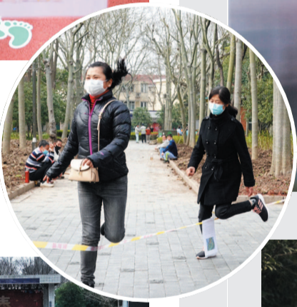
■ 两位童心未泯的女士在重新开放的徐家汇公园用警戒线跳皮筋