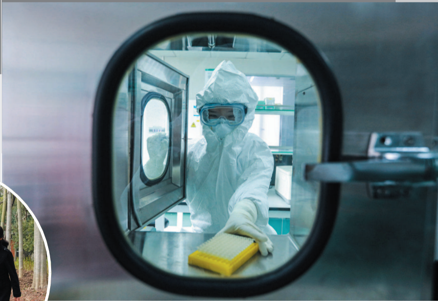
■ 上海金域医学检验所,核酸检测员传递待检测样本