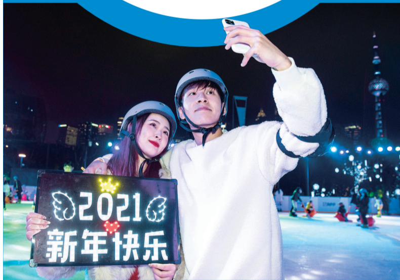
■ 一对情侣冰上迎新