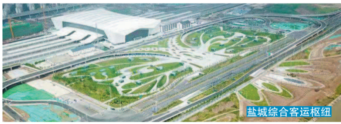
盐城综合客运枢纽

上海临港集团、光明集团、上海电气、上海复星、和硕集团、铠胜电子、英能新能源等一批世界500强和上海100强企业已在盐落地建成。目前在盐投资的上海企业近500家，总投资超1700亿元。