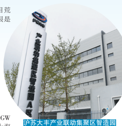
沪苏大丰产业联动集聚区智造园

目前，总投资64亿元的2GW移动能源产品制造汉瓦项目、上海农场年产13000吨农副产品加工项目、投产后年生产加工100万平方米