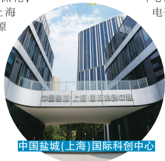
中国盐城(上海)国际科创中心

截至目前，盐城(上海)国际科创中心已有华人运通、中国电子科技、西诺德牙科设备、源和智能科技等60多家企业入驻。未来，科创中心将吸引更多符合盐城产业发展的科技类、创新型研发机构进驻，进一步丰富科创中心内涵，充分发挥科创载体作用。