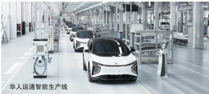
华人运通智能生产线