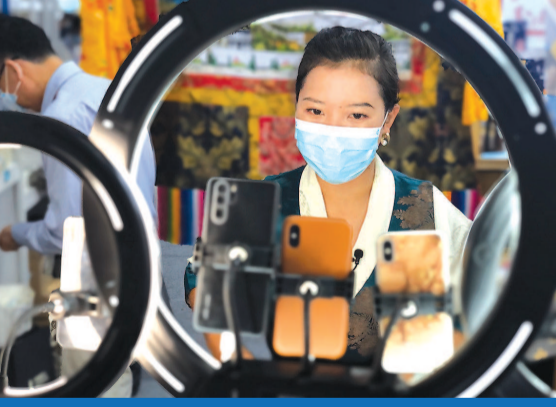
■ 尼玛普尺在直播中