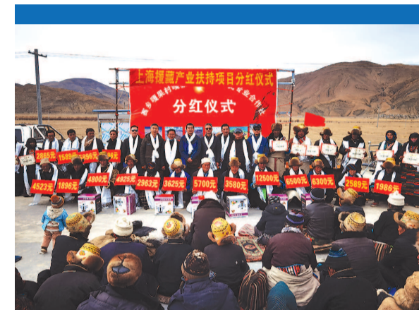
■ 萨迦县赛乡农机合作社分红