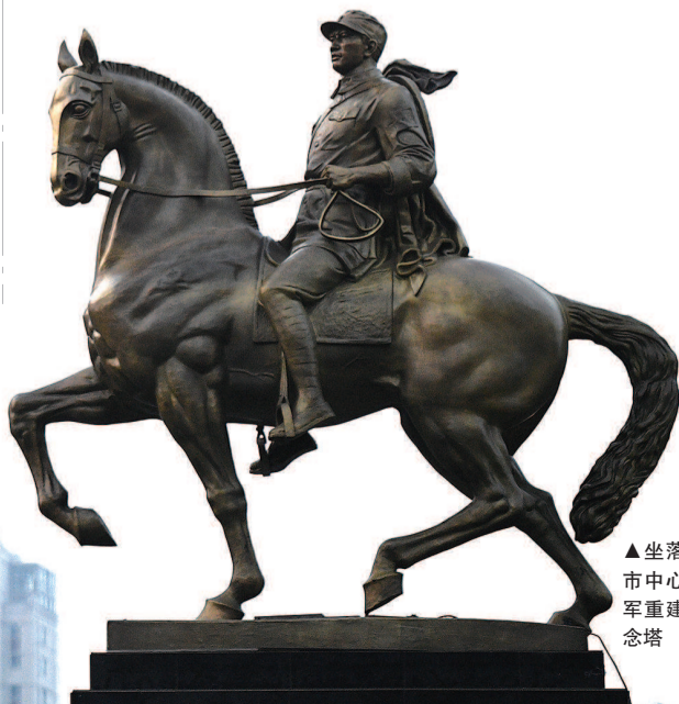
▲坐落在盐城市中心的新四军重建军部纪念碑塔

战火连天,峥嵘岁月,盐城与上海两座城市有着深厚的红色血脉联系,两地的爱国战士挥洒热血,团结一心,夺取胜利,红色基因代代相传。